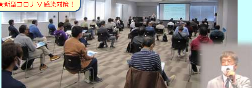
司会進行&3業界の概要紹介 奥田ナビゲーター →