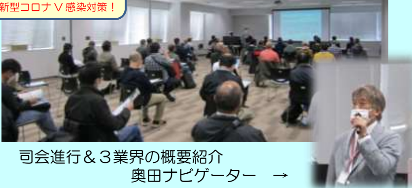
司会進行&3業界の概要紹介 奥田ナビゲーター →