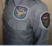
三島代表取締役 制服とエンブレム