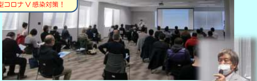
司会進行 & 3業界の概要紹介 奥田ナビゲーター →