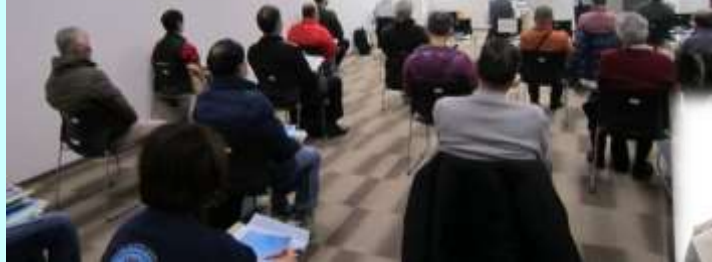
司会進行&3業界の概要紹介 奥田ナビゲーター →