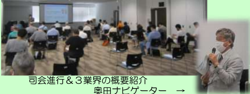
司会進行&3業界の概要紹介 奥田ナビゲーター →