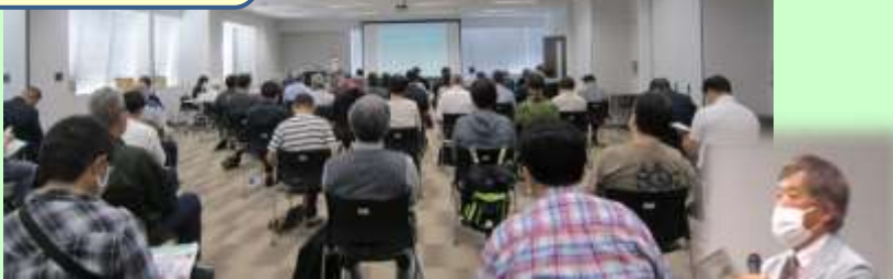
司会進行&3業界の概要紹介 奥田ナビゲーター →