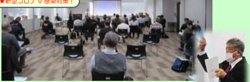
司会進行&3業界の概要紹介 奥田ナビゲーター →