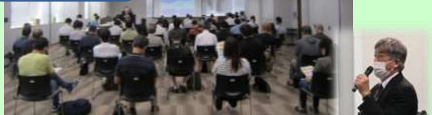
司会進行 & 3業界の概要紹介 奥田ナビゲーター →