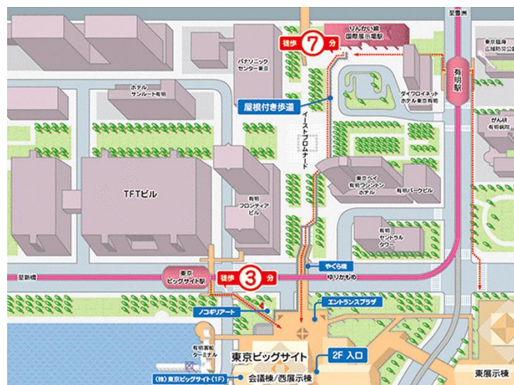
東京ビッグサイト会議棟1Fレセプションホール