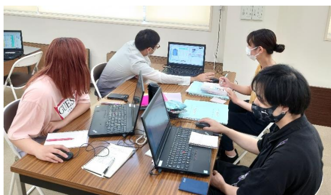
八王子新卒応援ハローワーク 新規大卒者等就職面接会