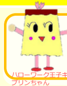
ハローワーク王子キャラクター プリンちゃん

会場内の人数を制限するため、事前にご予約いただいた面接時間に 合わせてご来場いただきました。応募書類は当日持参、1回あたり 15分～30分の面接を行いました。