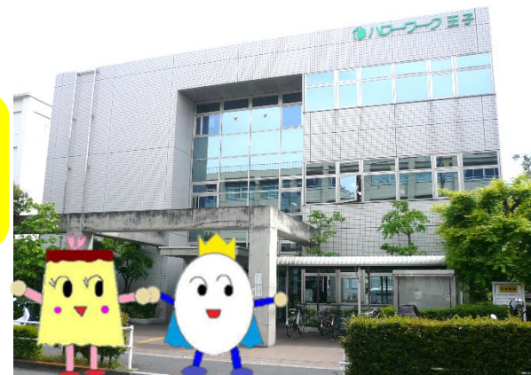
ハローワーク王子 企画調整部門