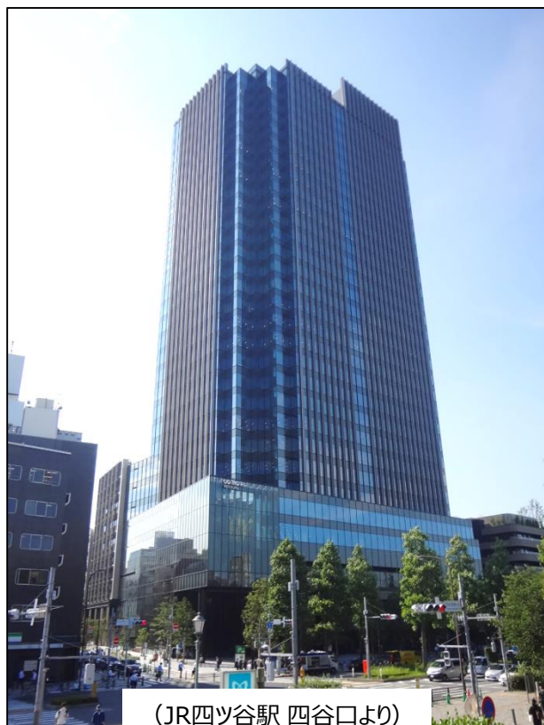
(JR四ツ谷駅 四谷口より)