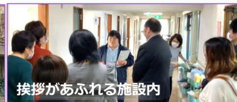
挨拶があふれる施設内