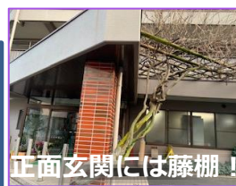
正面玄関には藤棚！

業務内容の説明を受けながら各階を見学しました。ボランティアの方によるレクリエーションや入居者・職員間のコミュニケーションの様子も見る事ができました。