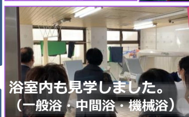
浴室内も見学しました。(一般浴・中間浴・機械浴)