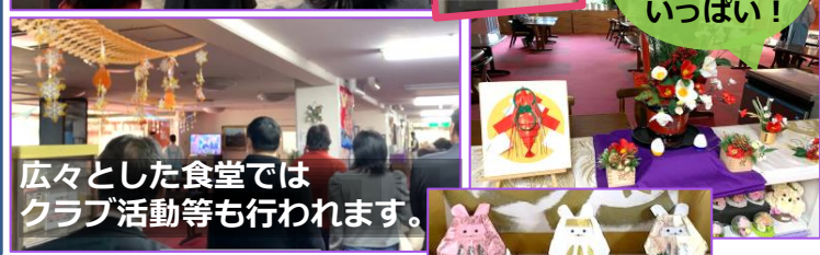
広々とした食堂ではクラブ活動等も行われます。