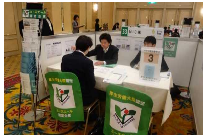
ユースエール企業