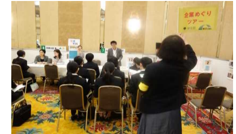
企業めぐりツアー②