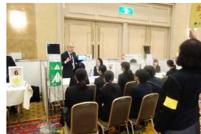
企業めぐりツアー①