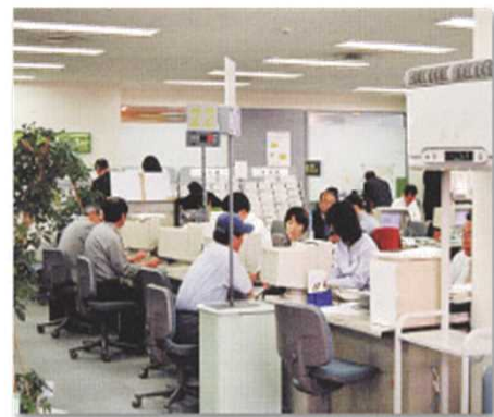
ハローワーク職員による相談

その後、様々な経験を通じ、労働行政のスペシャリストとして、専門職や幹部に昇進する道も開かれています。なお、幹部昇任時にはブロック内異動（概ね2年間）があります。