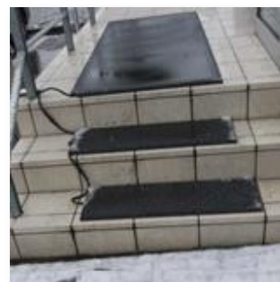
<ヒートマットの設置例>

天候による交通機関の遅れが見込まれる場合は、時間に余裕をもって出勤するようにし、落ち着いて作業をするように心がけましょう。屋外では、小さな歩幅で靴の裏全体を付けて歩くようにしましょう。