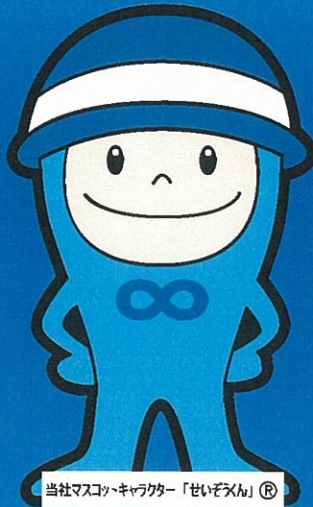
当社マスコットキャラクター「せいぞろい」®

※上記以外にも各営業所・オフィスがございます。他拠点の詳細につきましては、裏面をご確認ください。