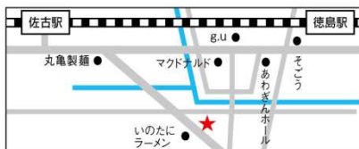
【徳島本社/徳島営業所】