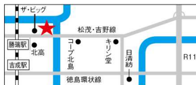
【北島登録センター】