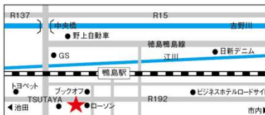
【鳴門登録センター】