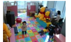
全オフィスに保育士を常駐安心してお仕事探しに専念