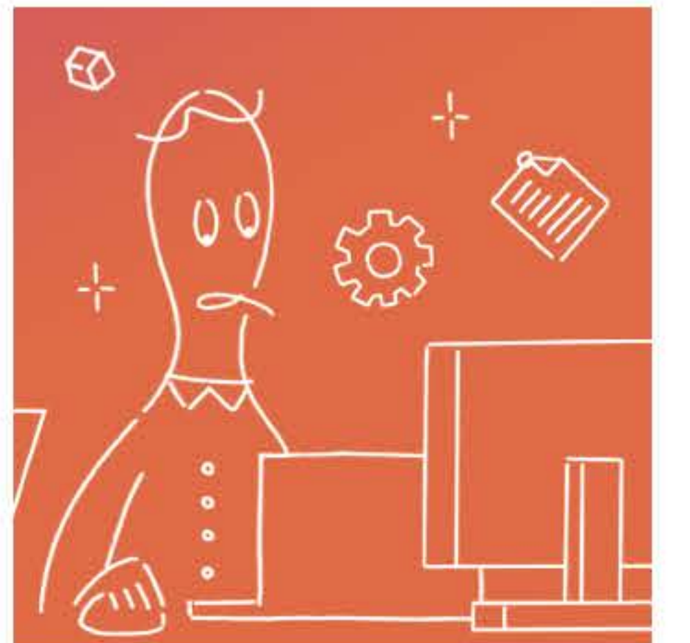
社内ヘルプデスク

自社サイトの更新・保守や広報物を一手に担う「会社の情報発信塔」。HP作成から社内資料のデザインまで幅広く対応できるため、外部業者に頼らずスピーディーに自社発信を行いたい企業から重宝されます。