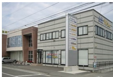
【四国進学会藍住校】

● 施設見学会 令和 7 年 4 月 8 日 ④ ～5 月 13 日 ④ 9 時～12 時の間で随時 (事前に電話連絡の程、お願いします)