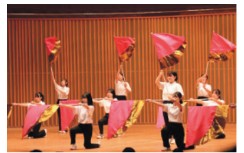
学生が作るイベント「おとぎのくに」

ミュージカルやダンス、ハンドベル、ブラックシアター、合唱を披露し ます。仲間と力を合わせて舞台を作り上げたことは一生の思い出に。