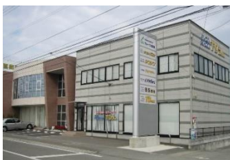
【四国進学会藍住校】

総合計 348時間 [学科 78時間 実技 270時間] ※就職相談日 (ハローワーク来所日) 3時間