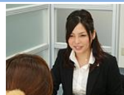
気になることがあれば何でもお気軽にご相談ください！