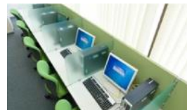
Word、Excel等のスキルアップ研修もご利用ください(無料)。