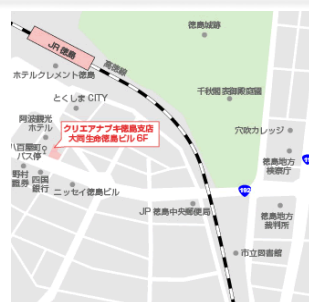
事業所へのアクセス