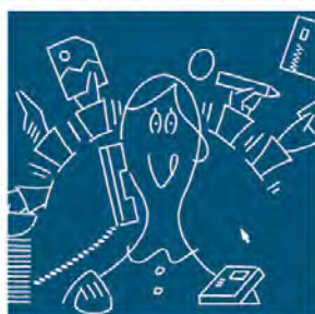
ネットショップ担当

Webデザイナーが作ったデザインをもとに、HTMLやCSSでWebページを作成します。JavaScriptなどのプログラミングを行うことも多いです。