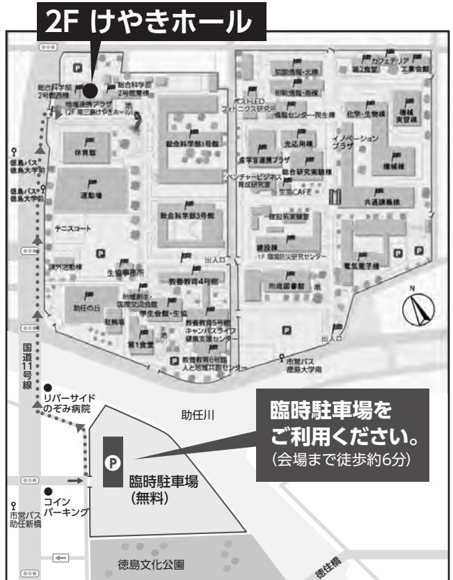
※臨時駐車場は変更になる場合があります。