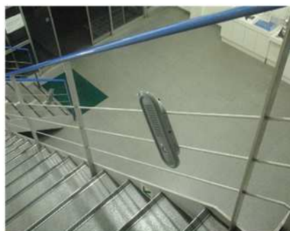
音声が入れる装置