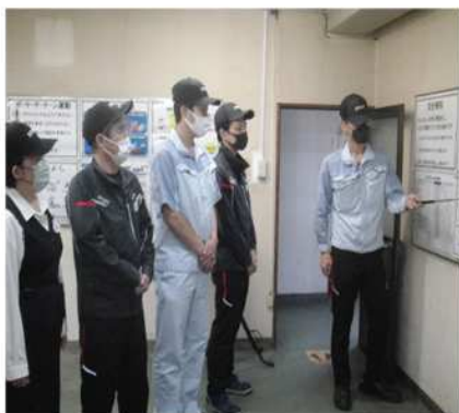
安全道場での教育

昨年度は、刃物の切れ味体感、重量物運搬のKY体験、交通安全について安全教育を実施しました。