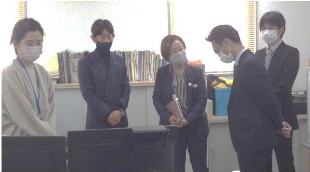
事務所を視察し、説明を受ける局長と監督課長