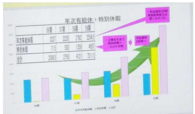
(休暇取得の推移を示すグラフ)