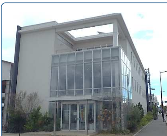
(喜多機械産業(株)本社 外観)

そのほか、喜多機械産業では、どうやったら前向きに仕事に取り組めるか？それには笑顔であること、健康であることが重要であるという考えのもと、健康経営にも積極的に取り組んでおり、「笑顔あふれ 選ばれ続ける企業」(お客様にも、社員にも、求職者の方にも)を目指して、「働き方改革」を一步進めた「 働きがい改革 」を進めていくとのことでした。