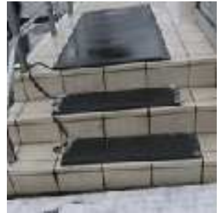
< ヒートマットの設置例 >

駐車場内、駐車場から職場までの通路を確保するため、除雪や融雪剤の散布を行いましょう。また、出入口では転倒防止用マットを敷き、夜間は照明設備を設けて明るさ（照度）を確保しましょう。