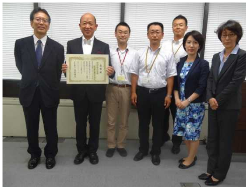
生田職業安定局長からの表彰状授与と記念撮影