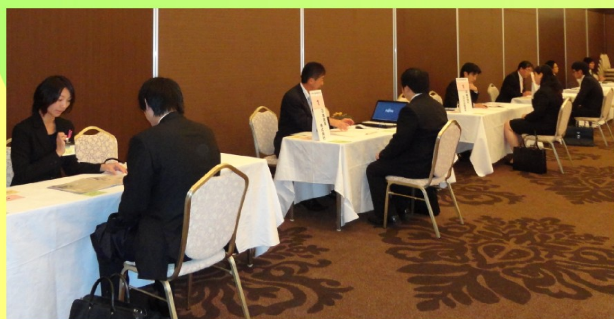
合同就職面接会の様子