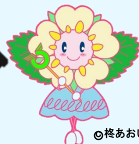
◎ 終あおい 壬生の妖精 ミーナ