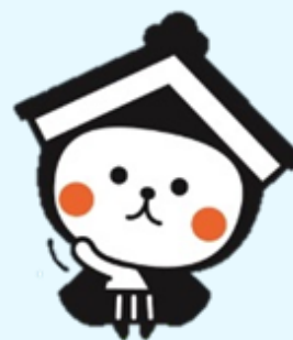
栃木市マスコットキャラクター とち介