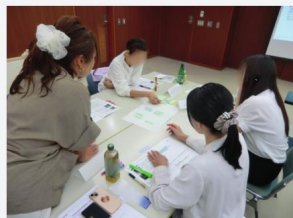
令和7年度の養成講座の様子

自社の働き方改革の推進員として必要な知識を学び、変革を牽引できるスキルを身につけます。(1社2名以上での参加がお勧めです)