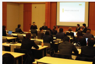
令和7年度の成果報告会の様子