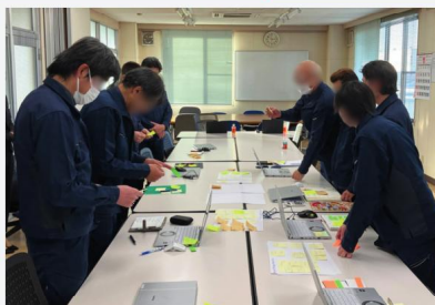
ユニ工業株式会社のカエル会議®の様子

3600社以上の実績をもとに、1社1社の課題に合わせて、専門コンサルタントが、伴走支援いたします。