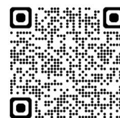
栃木県の職業訓練コース