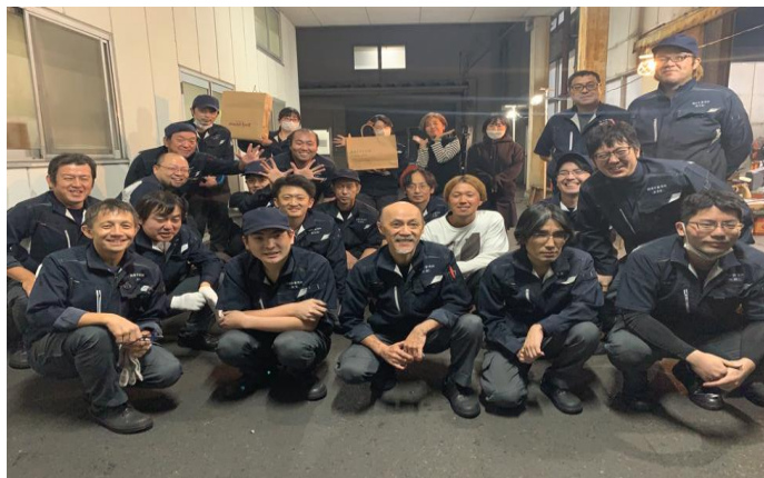
年2回会社敷地内にてBBQ