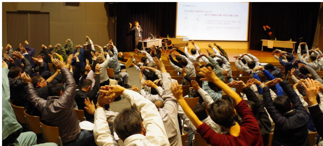
↑ 栃木県産業保健総合支援センターの講習の様子