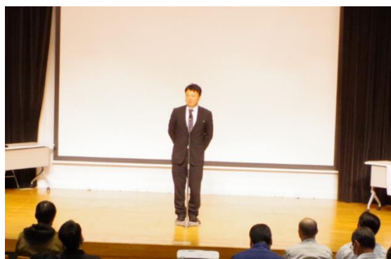
↑ 真岡労働基準監督署長あいさつ

講習会では、真岡労働基準監督署から署管内の労働災害発生状況を説明し、中央労働災害防止協会、栃木産業保健総合支援センター、栃木県県東健康福祉センターから講師を招き、転倒や捻挫・腰痛などの行動災害防止に関する特別講演をいただきました。