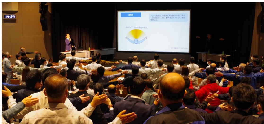
↑ 中央労働災害防止協会の講習の様子