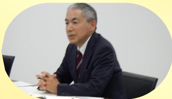
栃木労働局 局長 川口 秀人