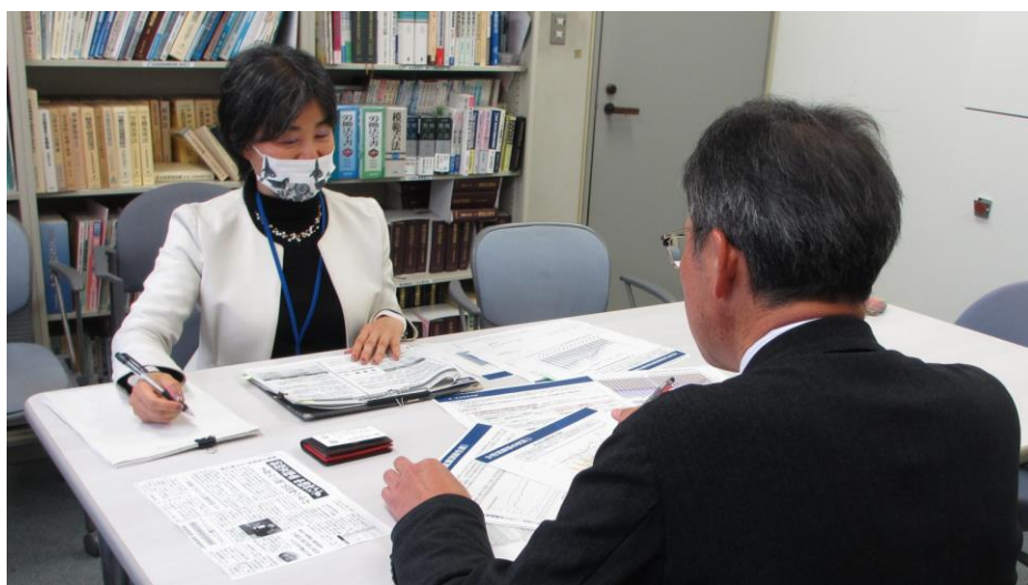
取材を受ける雇用環境・均等室長（左奥）

折しも改正女性活躍推進法により令和8年4月より従業員数101人以上の企業は「男女間賃金差異」及び「女性管理職比率」の情報公表が義務となることも併せて紹介しました。