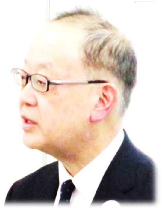
栃木労働局長 奥村 英輝

過労死等防止啓発月間における過重労働解消キャンペーンの取組の一環として、令和5年11月13日（月）に栃木労働局長が長時間労働削減等働き方改革に積極的に取り組んでいる