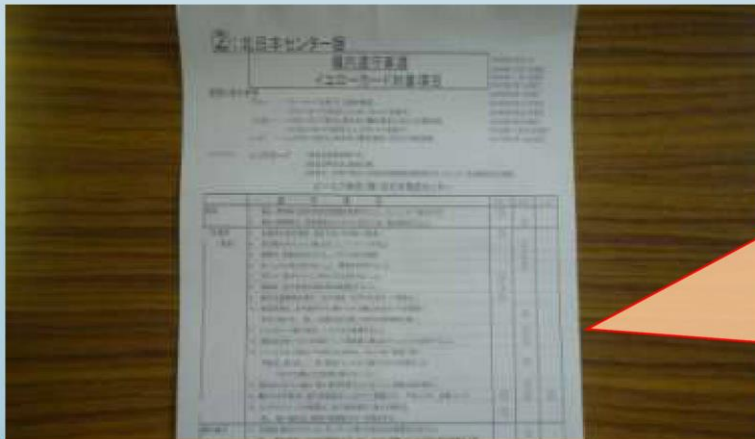
イエローカード チェックシート