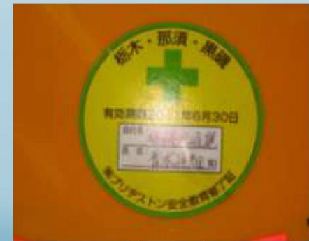
エビデンス シール