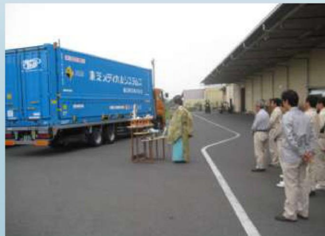
新設鉄道輸送機器 の安全祈願