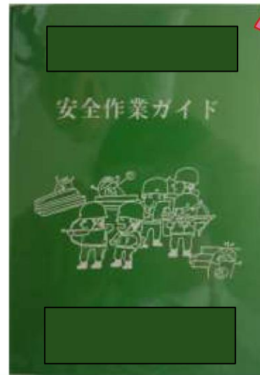
安全教育にて配布