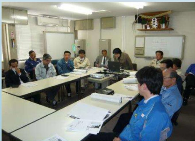
事業場安全衛生 協議会