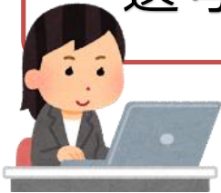
求人者マイページホーム画面（イメージ）