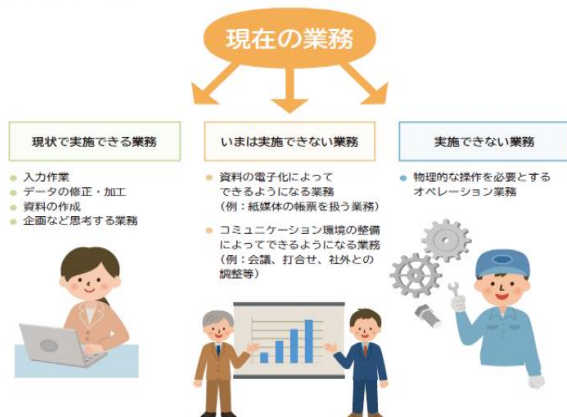
■ 図表 II-4-1 対象業務の整理