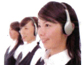
24時間いつでもお電話下さい!