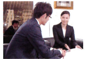
業界に精通した専任がマン・ツー・マンでサポート!