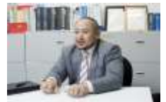
業界に精通した コンサルタントが サポートいたします