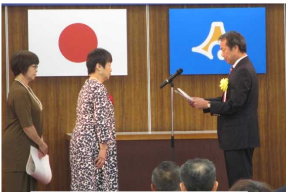
静岡県障害者雇用促進大会 表彰式の様子