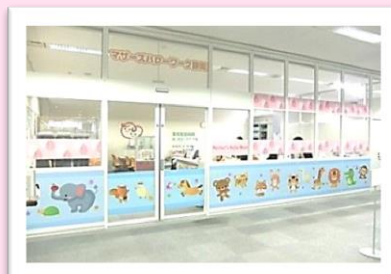
マザーズハローワークの外観