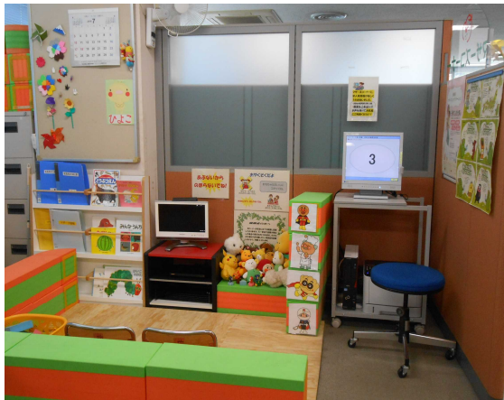
設備が充実した『マザーズコーナー』

なお、昨年度から問題になっていた、育児休業を取得した際、幼児の退園依頼の現状は改善されてきているといったお話をいただくなど、活発な情報交換が行われた。