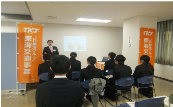
各企業ブースの説明

《参加者からの感想》◎学生から：あまり興味のなかった職種のことを知ることができた。若手社員からの説明で会社を身近に感じられることができた。より踏み込んだ内容の話が聞けて良かった。企業の本音を聞くことができた。貴重なアドバイスを聞くことができた。◎企業から：有意義な企画だったので同様のイベントがあれば、今後も参加したい。多くの学生と話をすることができて良かった。