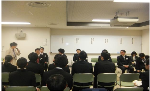
フリートーク形式の座談会