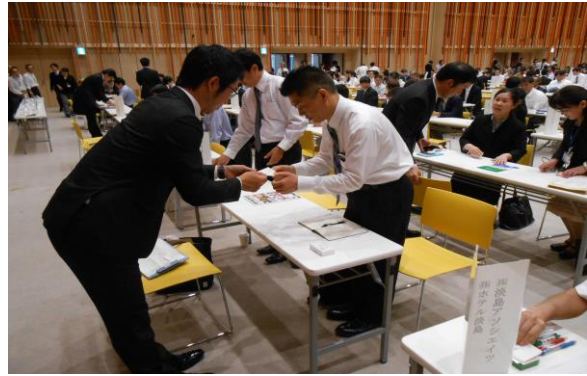
企業と学校教諭との名刺交換